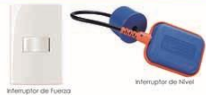
Interruptor de Fuerza