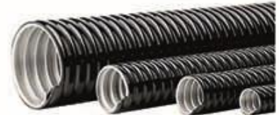
Tubos Metalicos con PVC