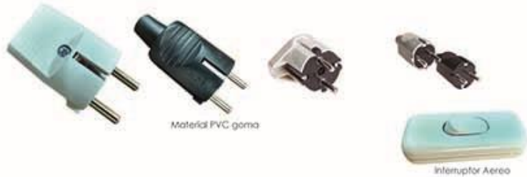
Material PVC goma