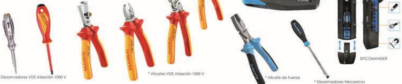
* Desarmadores VDE Aislación 1000 V