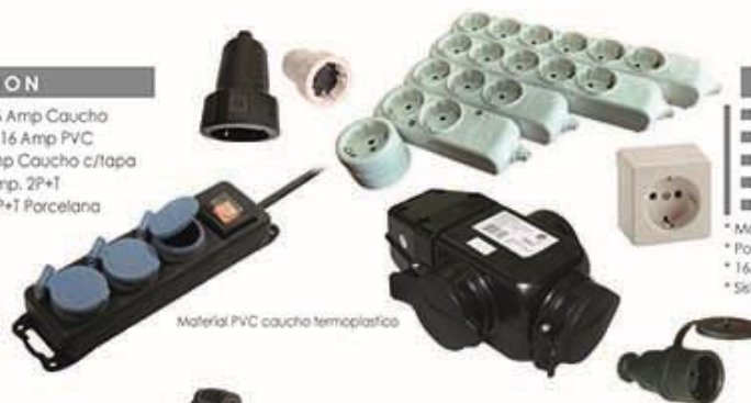
Material PVC caucho termoplastico